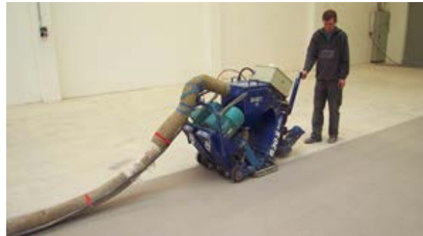
Kugelstrahlmaschine im Einsatz

zen und somit ist es kaum möglich groben, harten, zähen und tief eingedrungenen Schmutz zu beseitigen, wie das mit der Fräsmethode möglich ist.