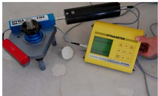
Haftzugprüfung mit Bruchbild und Stempel

Um nach entsprechend durchgeführten mechanischen Vorbehandlungen des jeweiligen Untergrundes zu ermitteln, ob die durchgeführten Maßnahmen ausreichend gewesen sind, empfehlen wir ggf. Haftzugprüfungen durchzuführen, um eine erhöhte Sicherheit für alle nachfolgenden Verlegearbeiten zu bekommen. Dabei muss neben dem sich ergebenden Bruchbild am Haftzugstempel beurteilt werden, in welcher Zone oder Schicht der Bruch erfolgt ist, um anschließend u.U. weitere notwendige mechanische Abtragungen vorzunehmen. Je nach zu erwartenden Belastungen für die Nutzungsdauer des Bauvorhabens sollte der Haftzugwert jedoch mindestens 1 N/mm 2 betragen.