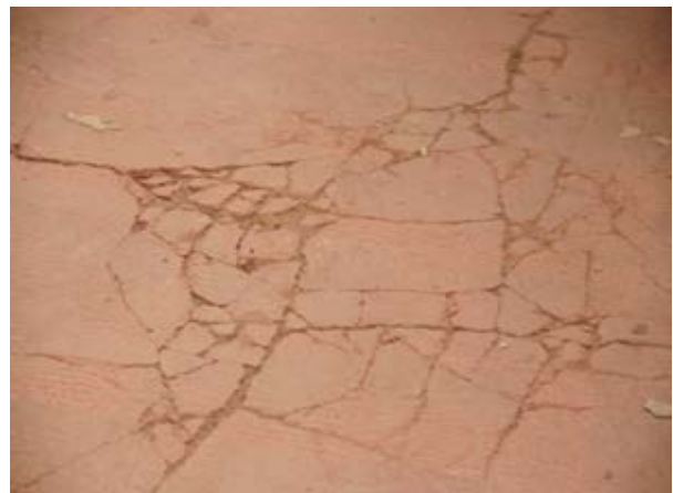
Maroder, nicht tragfähiger Untergrund

Wenn eine Verlegung auf fragwürdigen Untergründen erfolgen soll, muss der Verleger große Sorgfalt walten lassen und den Auftraggeber vorzeitig auf die Risiken hinweisen, bzw. Bedenken nach VOB/B § 4 Nr. 3 geltend machen.