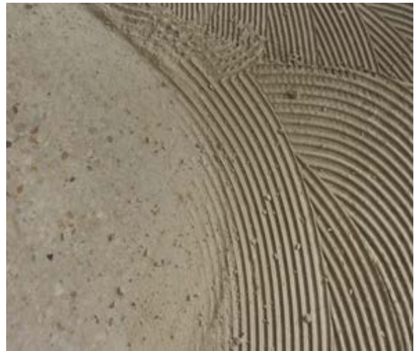
Teilweise abgeschliffener Fliesenklebstoff

Mit der Schleifmethode können diverse Untergründe eben und sauber bis in die Randbereiche abgetragen werden ohne größere Staub- und Geräuschbelastung, wenn die geeigneten modernen Maschinen zum Einsatz kommen.