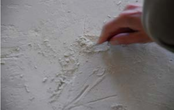
Labile Oberfläche in einem Calciumsulfat-Estrich

Für den Fall, dass bestimmte Bereiche innerhalb einer Estrichfläche sehr begrenzt offensichtlich zu geringe Druckfestigkeiten aufweisen, sollte eine Probe heraus geflext und diese dann in einem geeigneten Labor auf die erforderlichen Festigkeitswerte hin überprüft werden. Betragen die Druckfestigkeiten nicht mindestens 20 N/mm 2 , muss an dieser Stelle der Estrich ausgebaut und neu eingebracht werden. Besondere Sorgfalt sollte immer in den Bauabschnitten vorherrschen, in denen nach der Inbetriebnahme größere Belastungen zu erwarten sind.