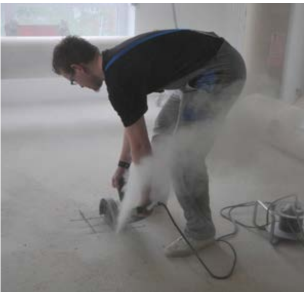
Entnahme einer Estrichprobe

Für den Fall, dass bestimmte Bereiche innerhalb einer Estrichfläche sehr begrenzt offensichtlich zu geringe Druckfestigkeiten aufweisen, sollte eine Probe heraus geflext und diese dann in einem geeigneten Labor auf die erforderlichen Festigkeitswerte hin überprüft werden. Betragen die Druckfestigkeiten nicht mindestens 20 N/mm 2 , muss an dieser Stelle der Estrich ausgebaut und neu eingebracht werden. Besondere Sorgfalt sollte immer in den Bauabschnitten vorherrschen, in denen nach der Inbetriebnahme größere Belastungen zu erwarten sind.