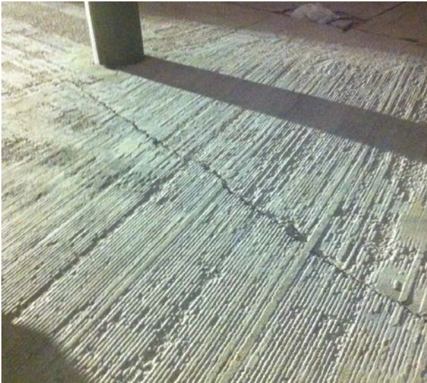
Oberflächenbild nach Fräsarbeiten