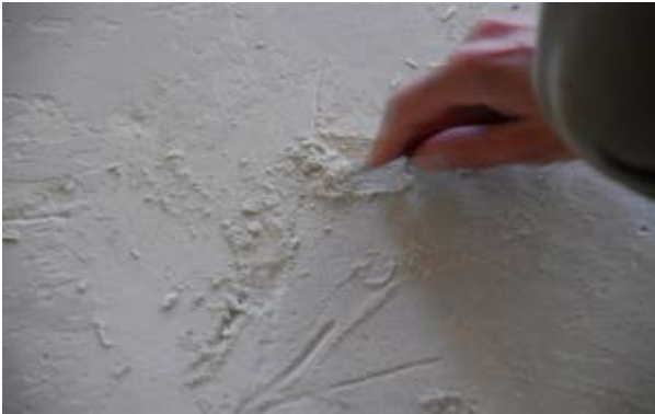
Labile Oberfläche in einem Calciumsulfat-Estrich

Für den Fall, dass bestimmte Bereiche innerhalb einer Estrichfläche sehr begrenzt offensichtlich zu geringe Druckfestigkeiten aufweisen, sollte eine Probe heraus geflext und diese dann in einem geeigneten Labor auf die erforderlichen Festigkeitswerte hin überprüft werden. Betragen die Druckfestigkeiten nicht mindestens 20 N/mm 2 , muss an dieser Stelle der Estrich ausgebaut und neu eingebracht werden. Besondere Sorgfalt sollte immer in den Bauabschnitten vorherrschen, in denen nach der Inbetriebnahme größere Belastungen zu erwarten sind.